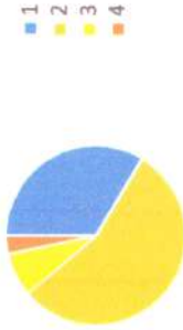
Gráfico da distribuição percentual dos tipos de despesa

Atenção: Esta aba será gerada automaticamente à medida em que as anteriores forem sendo preenchidas.